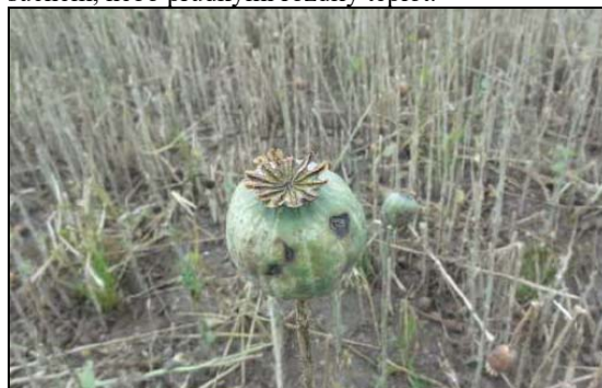
Makové pole po krupobití