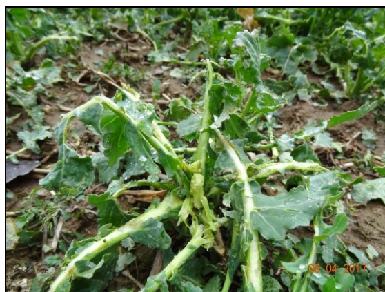
Řepka po krupobití z 2. dubna 2017