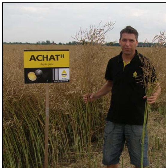
Hybrid jarní řepky Achat tvoří robustní porost lehce zaměnitelný s porostem řepky ozimé.

Progrese ve šlechtění jarní řepky jde neustále vpřed a každoročně se výnosová úroveň posouvá na nové hodnoty.