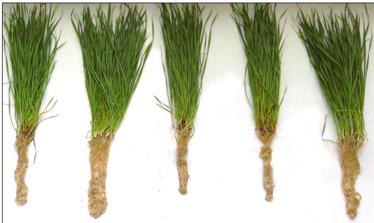
Foto č.1: Vliv účinné látky penthiopyrad na kořenový systém obilniny při včasné aplikaci

Účinná látka penthiopyrad okamžitě proniká listovou pokožkou a je rychle transportována povrchovým rostlinným pletivem. Jedná se o pohyb z místa aplikace dále do okolních neošetřených částí, např. od báze po špičku listu, ale ne do celé rostliny. Penthiopyrad je tedy lokálně systemická látka. V pletivu má ale i translaminární pohyb a to z vrchní na spodní část listu a tak je konečně fázi chráněn celý list rostliny. Další výhodou účinné látky penthiopyrad je, že se rychle vstřebává do voskové vrstvy listu a zastavuje tak okamžitě cílové houbové patogeny během životního cyklu (např. růst mezibuněčného mycélia).